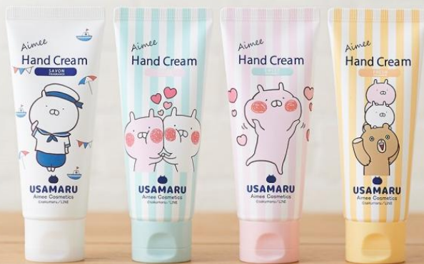
左から「サボン」、「リラックス」、「スウィート」、「フレッシュ」

◆メイクアップ オンラインストア◆ http://www.makeup-store.jp/SHOP/172238/list.html