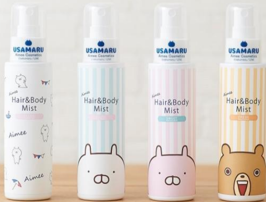
左から「サボン」、「リラックス」、「スウィート」、「フレッシュ」