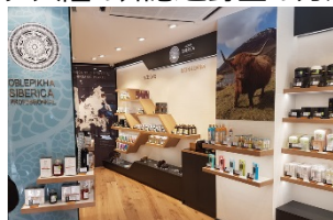
スペイン バルセロナ

「ナチュラ シベリカ」は、シベリアの野生植物を使った世界で唯一のオーガニックコスメブランドとして世界の40カ国以上で親しまれています。ロシアはもちろん、フランス、スペイン、デンマーク、香港など各国で販売されており、スキンケアアイテムやヘアケアなどのインバスアイテム、メンズ、ベビーケアシリーズまで250種類を超える幅広いラインナップです。特にシベリア松の実オイル※1といったナチュラシベリカならではの注目成分など、欧米にはないシベリア大陸の知恵と野生の力がつまった本格的なオーガニックコスメブランドが待望の日本上陸です。