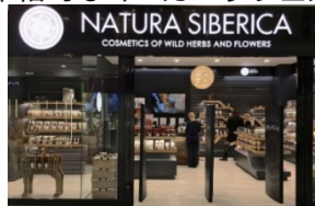
モスクワ ミチユリンスキー通り