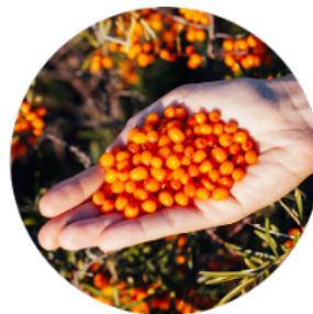
シーバックソーンの実

日本では「サジー」という名前で知られるシーバックソーン。オレンジ色に輝く果実がすこやかな美しさをサポートします。