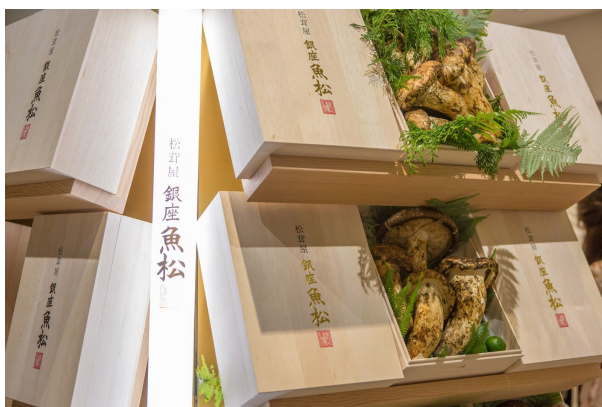
（銀座魚松エントランス）

2017年9月に東京都中央区銀座にオープンした松茸料理専門店『松茸屋 銀座 魚松』（以下、銀座魚松）は10月10日（火）にランチ営業を開始します。オープン前からランチについてのお問い合わせやご要望が多く、当初は11月に開始予定でしたが、約1ヶ月前倒しでランチのご提供を開始することとなりました。