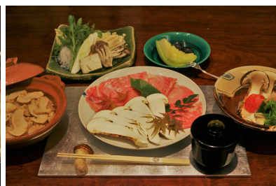
（しゃぶしゃぶランチコース）

モダンな雰囲気の内店でゆったりとしたランチタイムをお過ごしいただけます。女子会やデート、ご家族の団欒など、大切な方とのお食事にご利用ください。