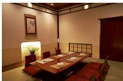
（掘りごたつタイプの個室）

モダンな雰囲気の内店でゆったりとしたランチタイムをお過ごしいただけます。女子会やデート、ご家族の団欒など、大切な方とのお食事にご利用ください。