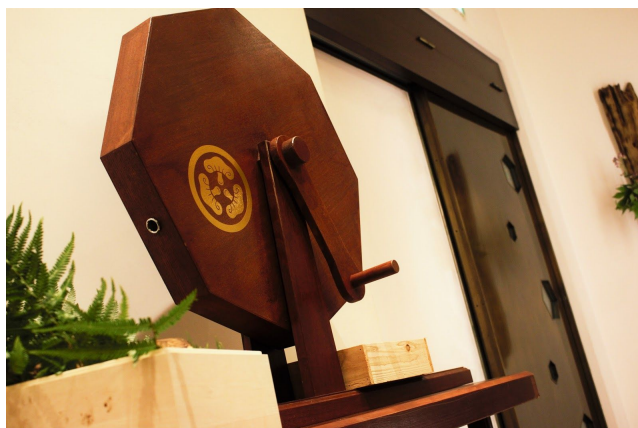
(銀座魚松名物ガラポン抽選会)

もちろん、ランチをご利用のお客様にも銀座魚松名物のガラポン抽選会にご参加していただけます。数万円～数十万円相当の松茸をはじめ、当社オリジナルの豪華商品が当たります。