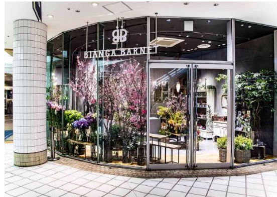
横浜ベイクォーター店

WEB : https://www.daiichi-engei.jp/biancabarnet/