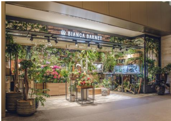
東京ミッドタウン日比谷店

架空のフラワーアーティストであるビアンカバーネットをイメージした第一園芸のフラワーショップとして2018年3月にオープン。日々の暮らしに花や緑を取り入れた“ボタニカルライフ”の楽しみを提案するため、店内には季節の花や観葉植物の他、インテリアやアクセサリ、雑貨など幅広い商品を取り揃えています。