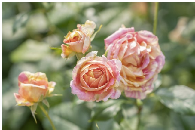
シンボルローズ「四季の香」

気温が上がりにくい午前中はとくに香りを感じやすいため、バラの散策におすすめの時間帯です。ぜひ朝のお散歩やお出かけ前に立ち寄って、フレッシュな春バラの香りに癒され、素敵な一日のはじまりをお迎えください。