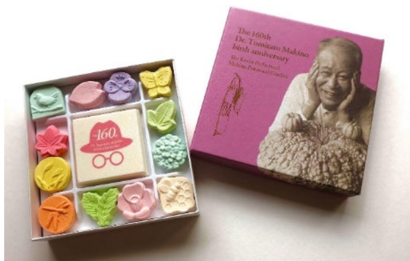
高知県立牧野植物園オリジナル和三盆 810円(税込)