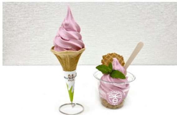
ローズソフト 400円(税込) / ガーデンパフェ 550円(税込)