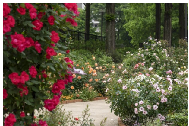
色彩のローズガーデン

《本件に関する報道関係からのお問い合わせ》第一園芸株式会社 ブランド推進部 岡本