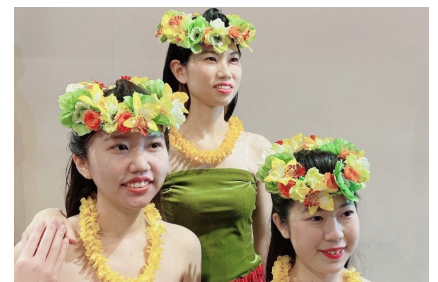
WAINANI HULA STUDIO