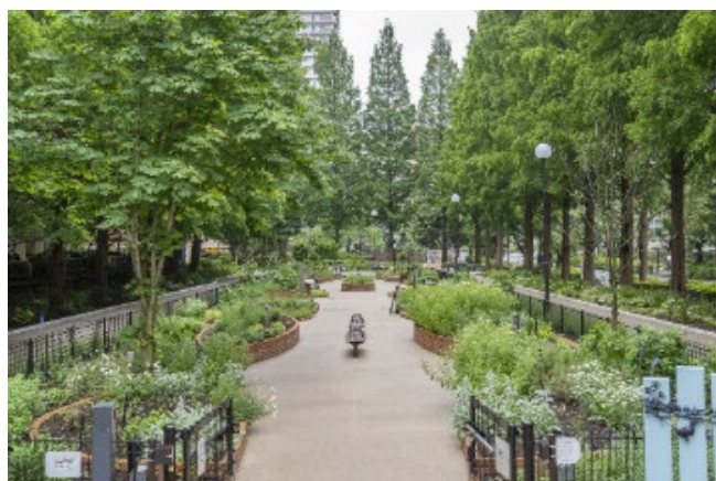
触れて楽しむ「香りのハーブガーデン」