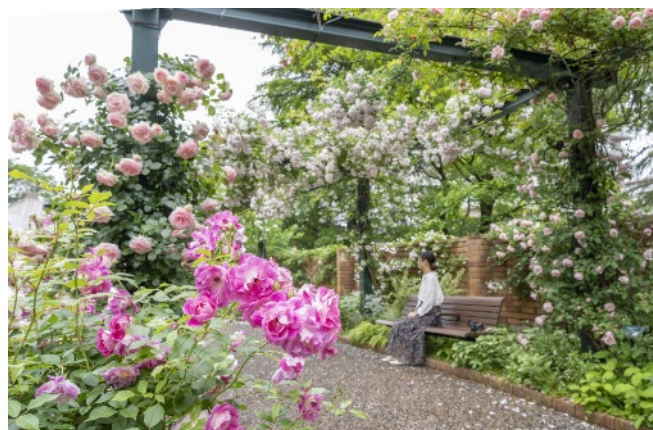
香りのローズガーデン回廊