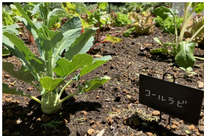
今年初の試みキッチンガーデン

五感で楽しむ「香りのハーブガーデン」は、キッチン・ティー・ポプリと用途ごとにハーブを植栽したガーデンです。ハーブに触れながらさまざまな香りを感じることができます。今年が初となるキッチンガーデンの野菜や心地よい香りのラベンダー、さまざまな用途で人気のローズマリー、清涼感のある香りのマトリカリアなどの花々とともにぜひ香りをお楽しみください。