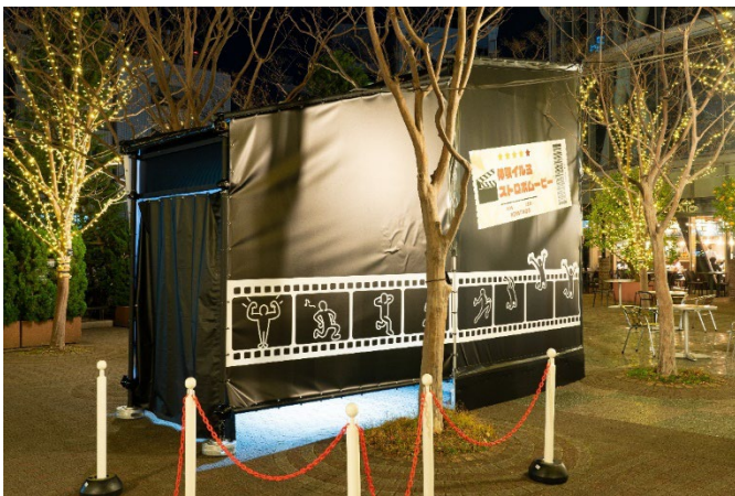
黒い幕に覆われた中でストロボ撮影が楽しめます

「半月のオブジェ」は、ご家族やご友人と一緒にポーズをとったり、一人で大きく半月をつかったポーズなどフォトジェニックなイルミネーションです。「罰ゲームルーレット」は、“愛してる人の名前を叫ぶ”などのお題の他に“足つばを3回渡る”の罰ゲームも記載されており、ルーレットの後ろに設置された足つばイルミを体験するなど身体を動かして楽しめるものになっています。