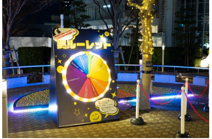
足つばイルミのある「罰ゲームルーレット」

ミーツポートガーデンでは、大きな半月のオブジェの前に立って全身でダイナミックな影絵遊びができる展示や、ルーレットに書かれたお題を行う「罰ゲームルーレット」をご用意しています。