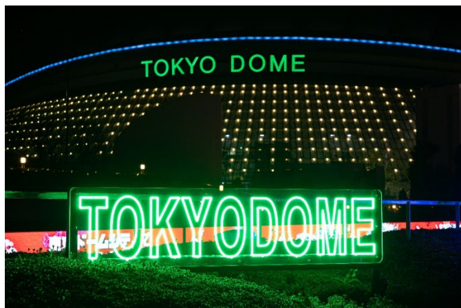
一部の文字が点滅すると読み方が変化します