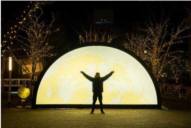
体験イルミの「半月のオブジェ」