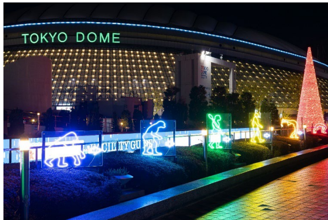
東京ドームを背景に楽しい写真を撮影できます