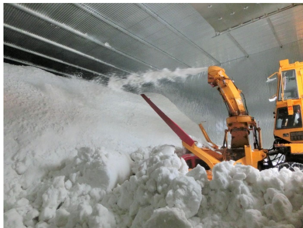
雪室へ雪を入れる様子

■7 月 7 日の七夕はカスミソウの日！福島・奥会津から自然の力を借りた「昭和かすみ草」をお届けします 夏秋期日本一の栽培面積、出荷量を誇る「昭和かすみ草」をご存じですか？昭和は時代ではなく、福島県・奥会津の地名です。昭和村には「雪室（ゆきむろ）」と呼ばれる集出荷施設があり、冬の間には 3,000 m 3 ほどの雪を運び込み、夏の間この雪を利用して予冷库を冷却。収穫した「昭和かすみ草」を最適な温度と湿度に調整し、全国に出荷しています。