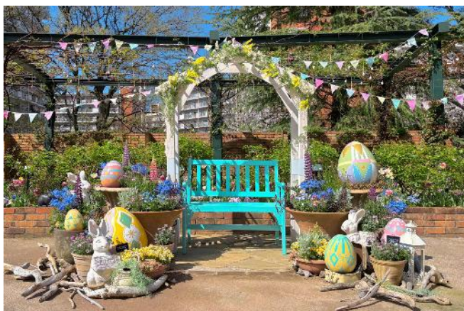
2025年のフォトスポット