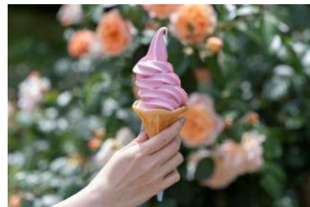
大人気のローズソフト 400円（税込）