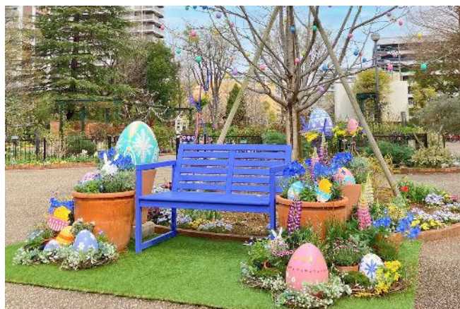
2025年のミニフォトスポット