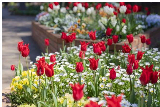
過去の園内の様子

今年も園内では、1 万本を超えるチューリップが 4 月の上旬ごろに開花シーズンを迎えます。第一園芸のガーデナーが厳選し、昨年の品種数を 15 品種超える 84 品種のチューリップが色鮮やかに咲き誇り、春の訪れを華やかに彩ります。