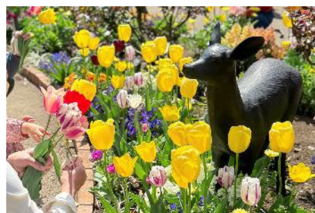
過去の開催の様子