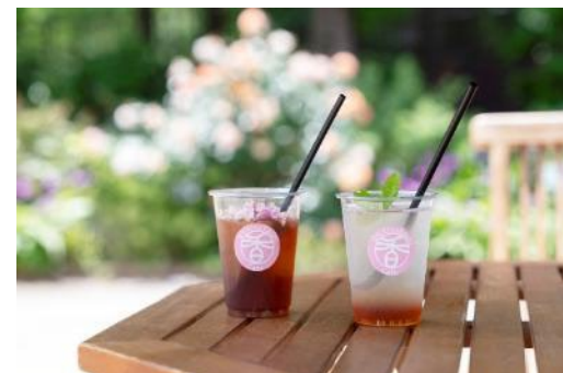
園内散策後にごゆっくりお過ごしください