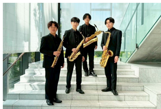
ローズガーデンサクソフォンカルテット