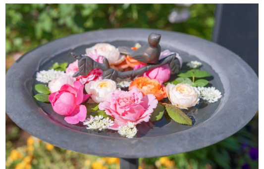
人気のバードバス