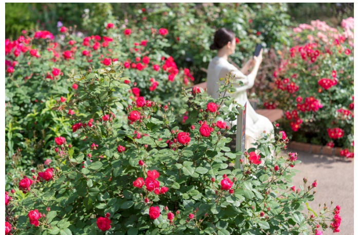
「色彩のローズガーデン」