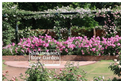
10周年記念フォトスポットイメージ