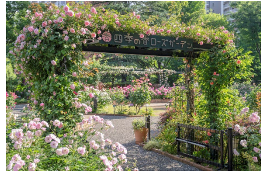
香りがテーマの「香りのローズガーデン」

また、園内で摘み取ったバラを水に浮かべた、小さな花園のような香り豊かな人気のバードバスも登場。豊潤なバラの香りに包まれたガーデンで、香りの違いを五感でお楽しみください。