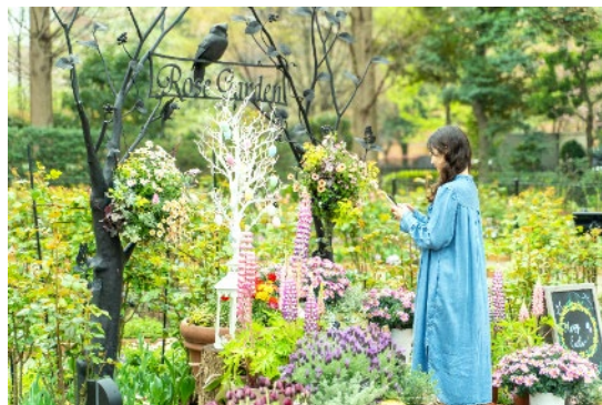
2023年のフォトスポット