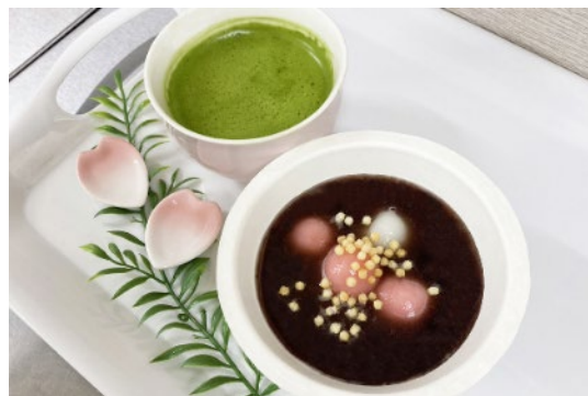
春のなごみセット 550円（税込）