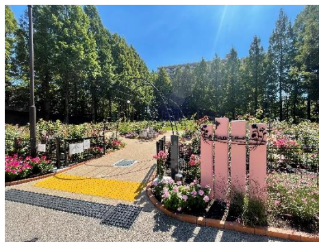
香りのローズガーデン