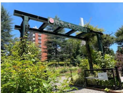
色彩のローズガーデン

5月の拡張リニューアルにより、より広々とした、密になりにくい空間となりました。夏の暑さに負けない元気な植物たちをぜひご覧ください。