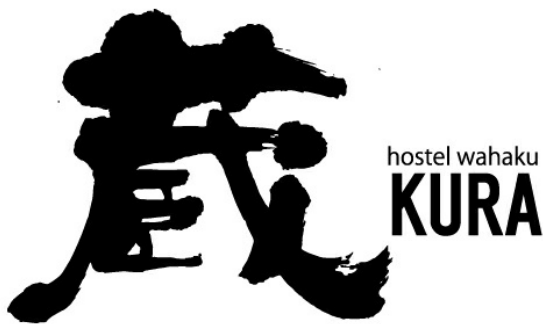
和箱 蔵 ロゴ/所在地

オープンキャンペーンとして、ご宿泊いただいたお客様には「御朱印帳」をプレゼントしております。屋上の「蔵前伏見稲荷」の御朱印も押印いたします。御朱印帳プレゼントは数がなくなり次第終了いたしますので、予めご了承ください。