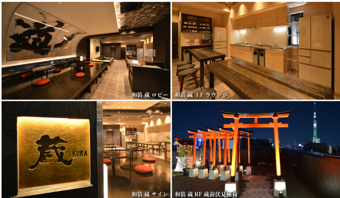
和箱 蔵 ロビー/RF

お客様をお迎えするエントランス部分では、NHK大河ドラマの題字などメディアでも活躍中の書道家・武田双雲氏作の「道」の展示や、畳の小上りを設置。外装部分では「杉板本実型枠」技法を用いた、杉板の木目が写ったコンクリートの打ちっぱなしや、金色のロゴサインが映える焼杉板を用いるなど、古き良き日本文化や技法と現代のアーキテクチャの融合をご覧ください。