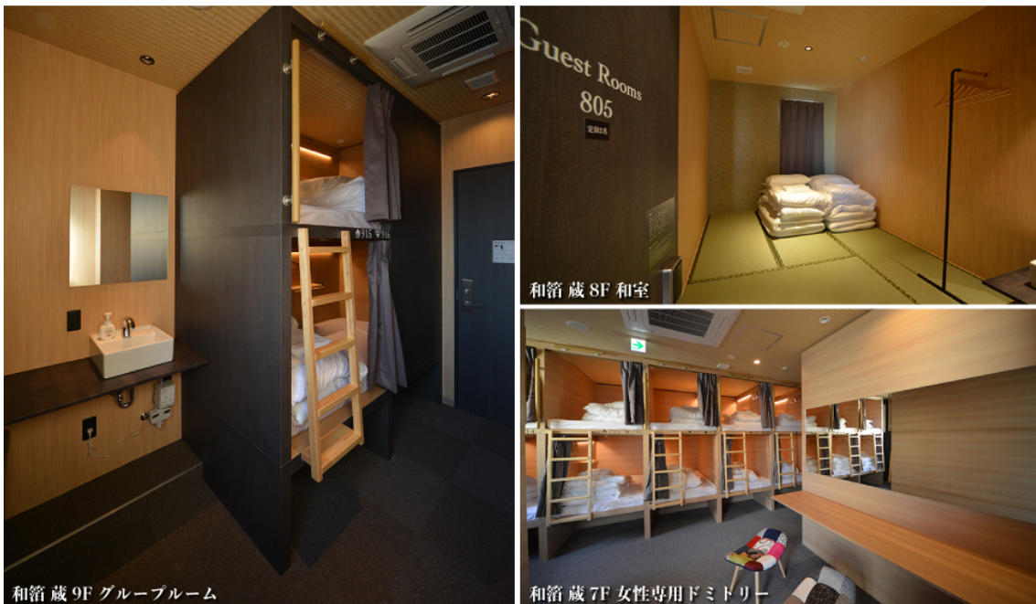
和箱 蔵 お部屋一例

屋上のルーフトップラウンジには「蔵前伏見稲荷」を建立。いにしへの日本から脈々とつづくお稲荷さんの朱塗りの鳥居と、平成に建てられたアーキテクチャの代表格である東京スカイツリーとのコラボ夜景がお楽しみいただけます。