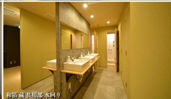
和箱蔵 共用部水回り