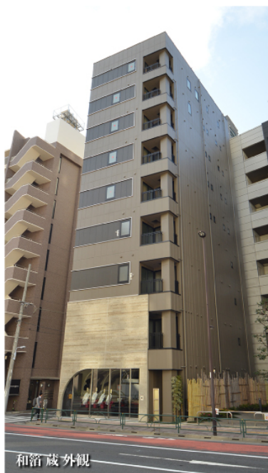
和箔 蔵 外観

「和箔」のロゴに用いている紋様は、「大樹の年輪」を模したものです。この紋様には、多くの動物が集まる大樹のように、世界中から人々が集まり、語り、休める宿として歴史を刻んでいきたいという思いを込めております。