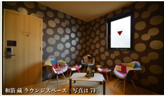
和箱蔵 ラウンジスペース（写真は7F）