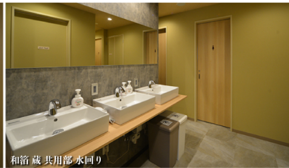
和箱蔵 共用部水回り