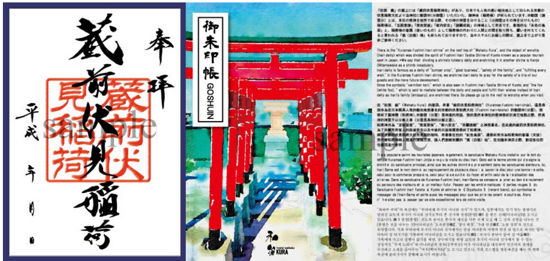
御朱印と御朱印帳