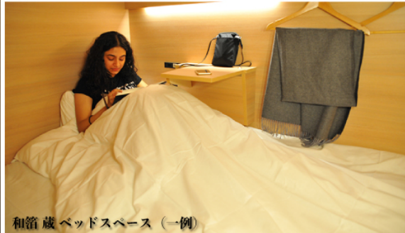
和箱蔵 ベッドスペース（一例）

各フロアとも天井高を高く確保し、開放的な設計デザインにいたしました。全てのドミトリーベッド内（畳敷きのプライベートルームを除く）に電源タップ、調光可能な間接照明、セキュリティボックス、PCで作業することも可能なミニテーブルを備えたオリジナルのベッドを使用しております。旅行だけでなくビジネスライクな旅行にも対応しております。