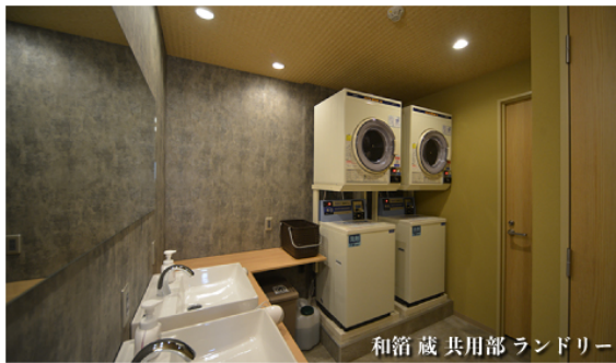
和箱蔵 共用部ランドリー

各フロアとも天井高を高く確保し、開放的な設計デザインにいたしました。全てのドミトリーベッド内（畳敷きのプライベートルームを除く）に電源タップ、調光可能な間接照明、セキュリティボックス、PCで作業することも可能なミニテーブルを備えたオリジナルのベッドを使用しております。旅行だけでなくビジネスライクな旅行にも対応しております。