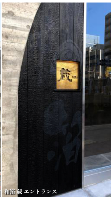
和箔 蔵 エントランス