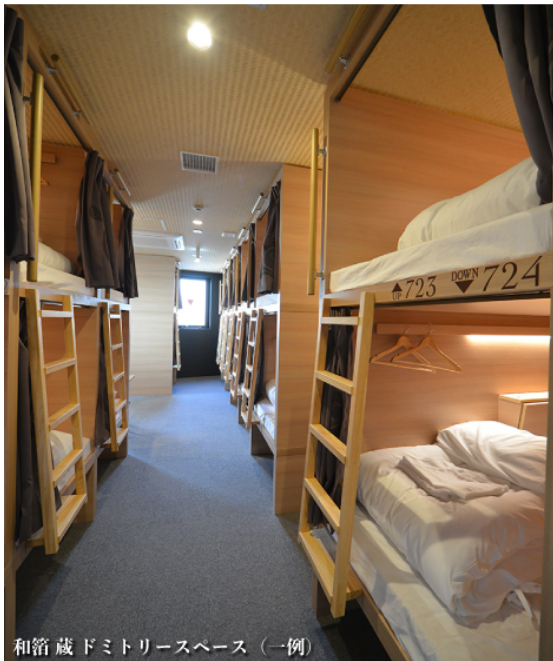
和箱蔵ドミトリースペース（一例）