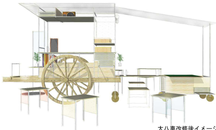
大八車改修後イメージ