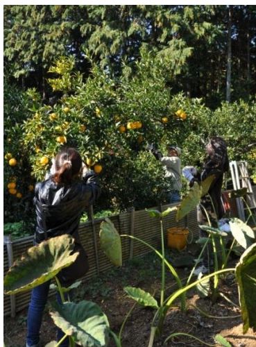
桂木ユズ収穫の様子