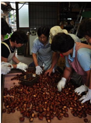
ぼろたん（クリ）収穫の様子

サティス製薬では、日本全国から“ピカイチ素材”を厳選し、担当研究員が産地へ直接足を運んで新たな国産原料の開発を行う「ふるさと元気プロジェクト」事業を推進しております。素材の生育に最も優れた土地、優れた生産者によって栽培される“ピカイチ素材”を化粧品原料にすることで、国産素材のブランド価値を高め、より競争力のある化粧品へと育てます。サティス製薬ではこの国産原料を、自社製品への配合のみならず、同業他社や各メーカーに販売することで、国産素材が生む新しい価値をさらに市場へ流通させることを目指しております。