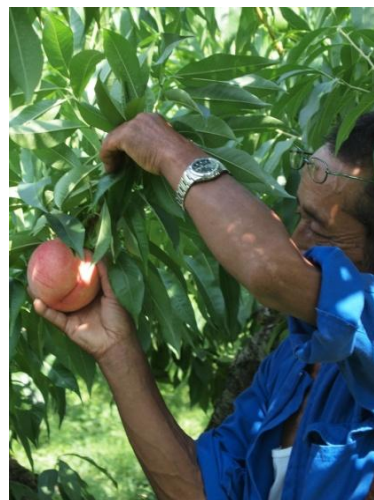
あかつき（桃）取材時の様子