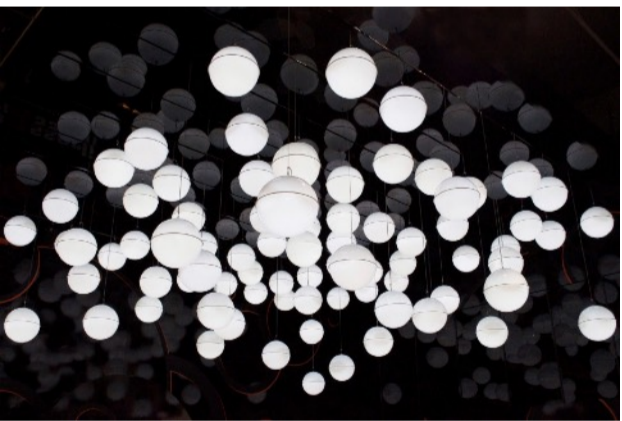
Clair de Lune -Sound Program Structures-