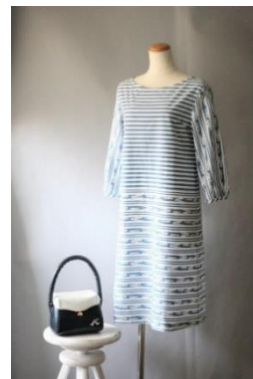
ギルダ横濱とのコラボが評価されたワンピース