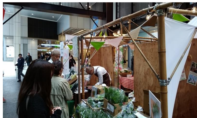
昨年10月の本イベントの様子