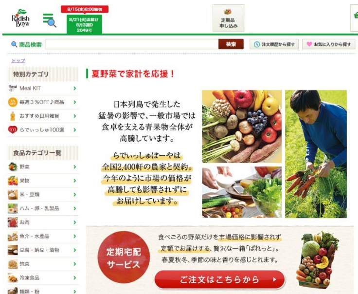
【サイト内ページイメージ】

（購入ページURL http://www.radishbo-ya.co.jp/shop/ ※購入には会員登録が必要です）