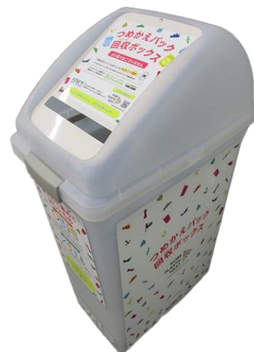
10月1日より設置予定の回収ボックス