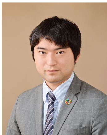
株式会社アイデミー

現在では個人向けに留まらず法人向けにもサービスを展開しており、企業のAIプロジェクト内製化に向け、教育研修から事業定義・試作品開発・実運用まで一気通貫でご支援しております。こうした事業を通じて、「先端技術が社会実装されるまでの壁」を取り除くべく尽力して参ります。