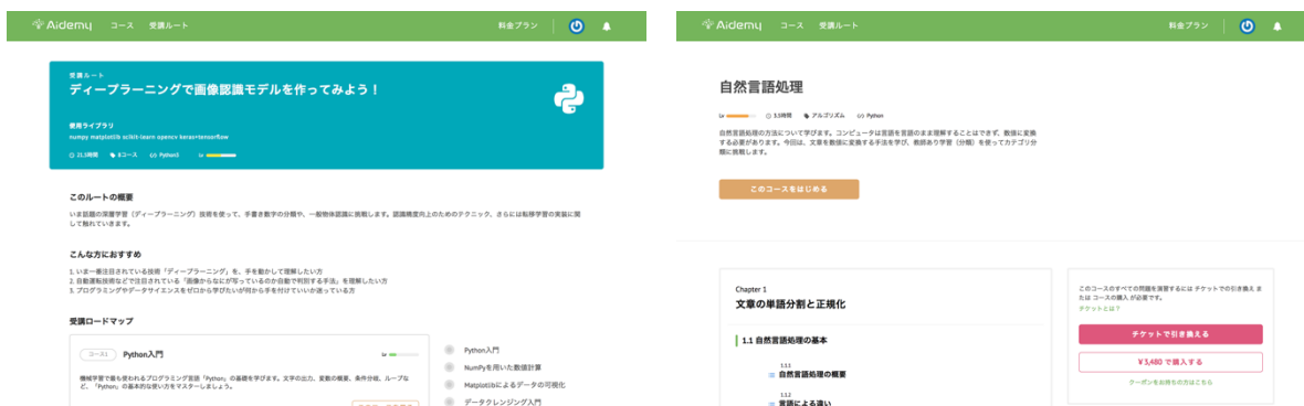
▲Aidemy の教材 (左:受講ルートページ, 右:受講コースページ) ▲