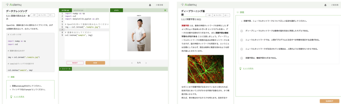
▲Aidemy の演習画面の例 (左:コードを書きながら学習する問題, 右:クイズに答えながら学習する問題) ▲