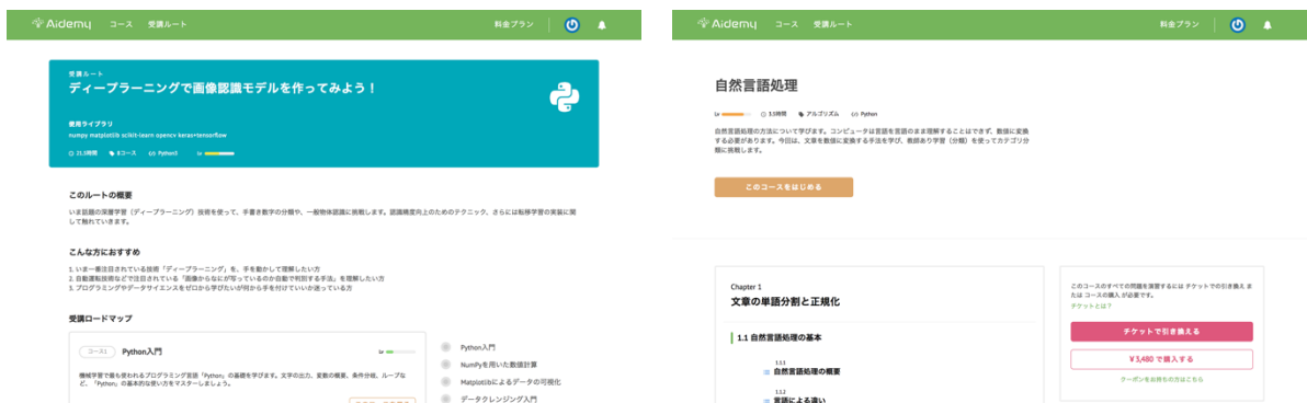
▲Aidemy の教材(左:受講ルートページ, 右:受講コースページ)▲