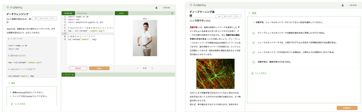
▲Aidemy の演習画面の例(左:コードを書きながら学習する問題, 右:クイズに答えながら学習する問題)▲