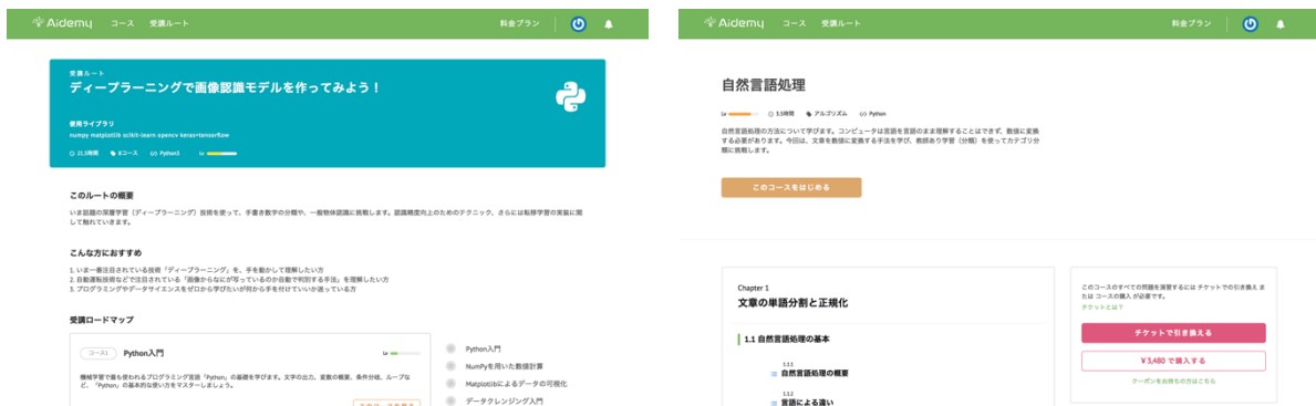
▲Aidemy の教材(左:受講ルートページ, 右:受講コースページ)▲