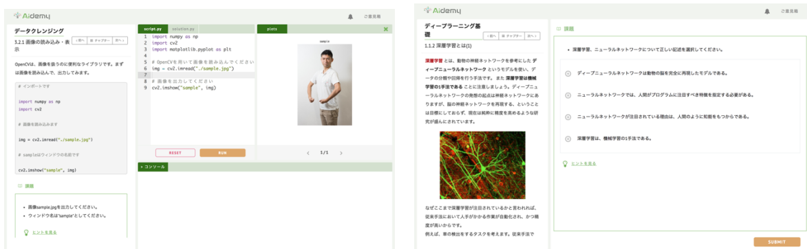
▲Aidemy の演習画面の例(左:コードを書きながら学習する問題, 右:クイズに答えながら学習する問題)▲