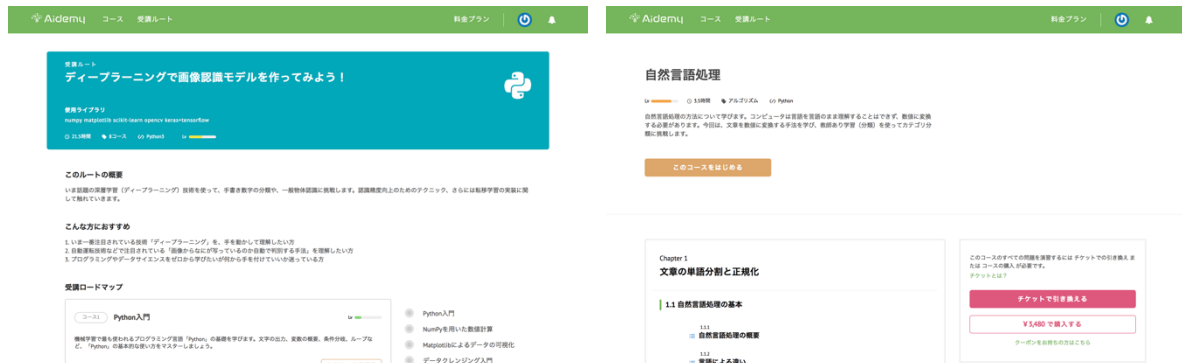
▲Aidemy の教材(左:受講ルートページ, 右:受講コースページ)▲