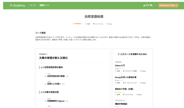
▲アイデミーの教材(左: 受講ルートページ, 右: 受講コースページ)▲