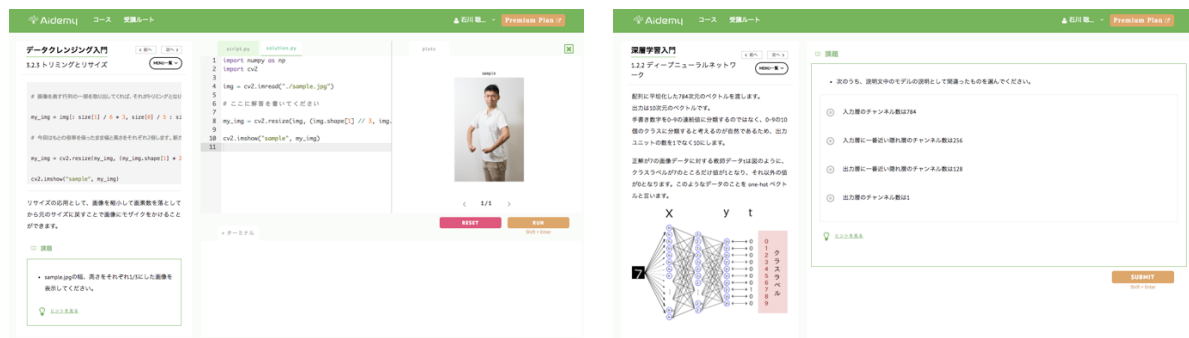
▲アイデミーの演習画面の例(左:コードを書きながら学習する問題, 右:クイズに答えながら学習する問題)▲