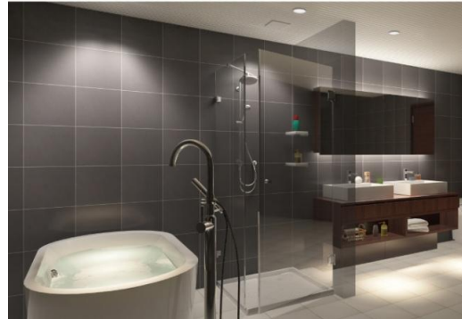
リラックスしたひとときをラグジュアリーバスで。