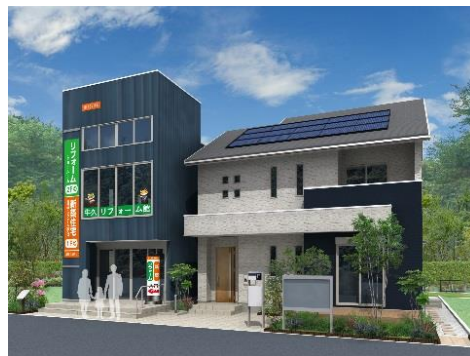
専門ショールーム 牛久リフォーム館（左）

「イメージしやすさ」に重点を置き、ショールームにはシンプルモダン、南欧モダン、アジアンテイストなどコンセプトごとにコーディネートしたLDKリフォームプランを複数再現。実際に体感、比較いただきながら趣向にあったインテリアコンセプトをお選びいただけます。さらにお客様自身で費用把握ができるように、リフォーム内容や部屋の広さに応じた商品・工事代金込みの価格設定となっております。