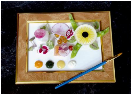
海の幸のジュレ 「ひまわり」 価格：2,000円