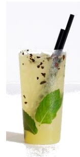
「サンフラワー」 価格：1,500円