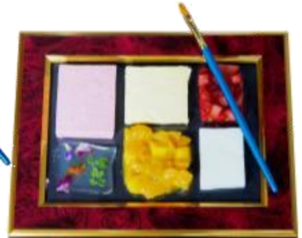
季節のフルーツ 「モザイク」 価格：1,200円