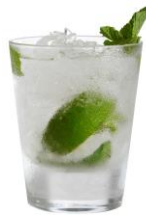
「ダッチカレッジ」 価格：1,500円