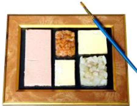
魚介のタルタル・柑橘のアロマ 「モザイク」 価格：2,000円