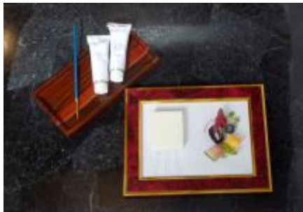
ブランマンジュと 季節のフルーツ 「アトリエのキャンバス」 価格：1,200円