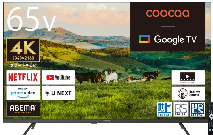
coocaa 65 インチモデル 65Y65