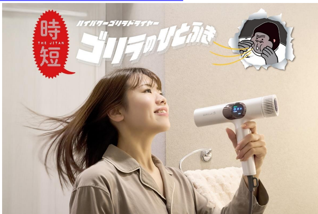
ゴリラのひとふき

URL: https://e-doshisha.com/hanako/gorilla_hitofuki/