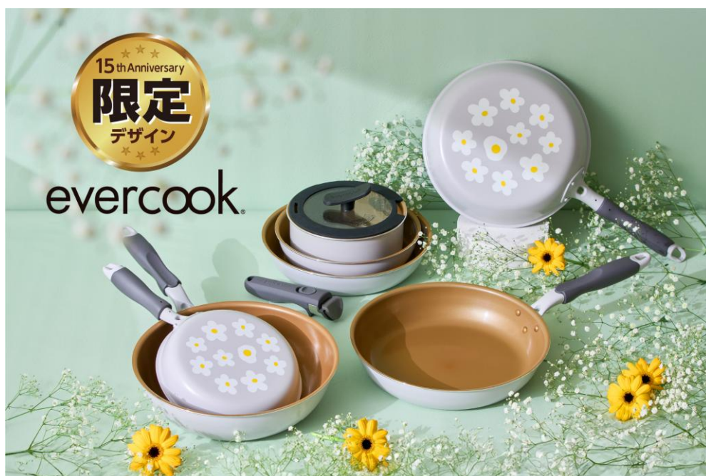
「evercook フライパン 15 周年限定デザイン」

URL : https://www.doshisha-marche.jp/c/lifestyle/LS-FP-15th