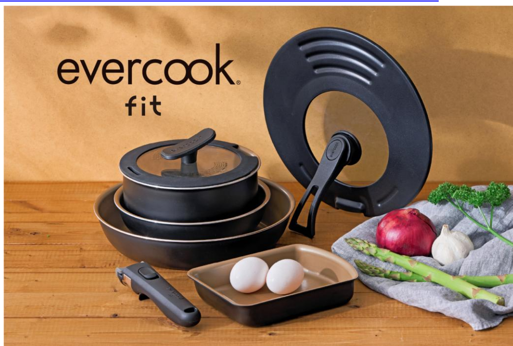
「evercook fit（エバークックフィット） IH 対応フライパン 8 点セット ブラック」

URL： https://www.doshisha-marche.jp/c/brand/evercook/evercook_fit