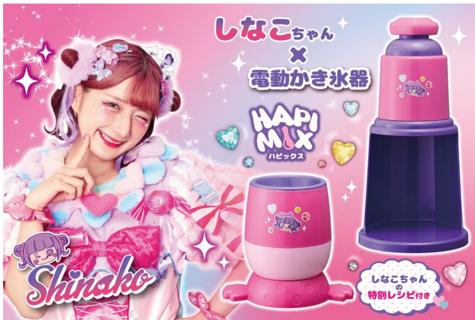
しなこちゃん×電動かき氷器/しなこちゃん×HAPI MIX (ハピックス)

商品ページ URL : https://do-cooking.com/koorikaki/ ・ https://do-cooking.com/hapimix/