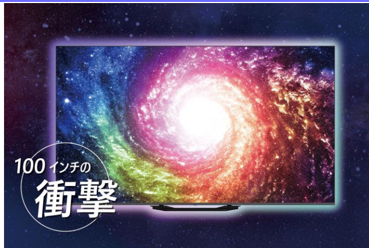
ORION(オリオン) チューナーレス スマートテレビ 100インチ

URL：(GLMK100U) https://www.doshisha-orion.com/tless-smarttv-glmk100u/ (GLK652U) https://www.doshisha-orion.com/tless-smarttv-gl652u/