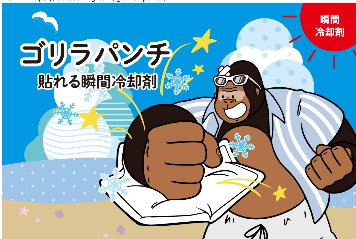
貼れる瞬間冷却剤「ゴリラパンチ」

URL： https://do-cooking.com/gorilla_punch/