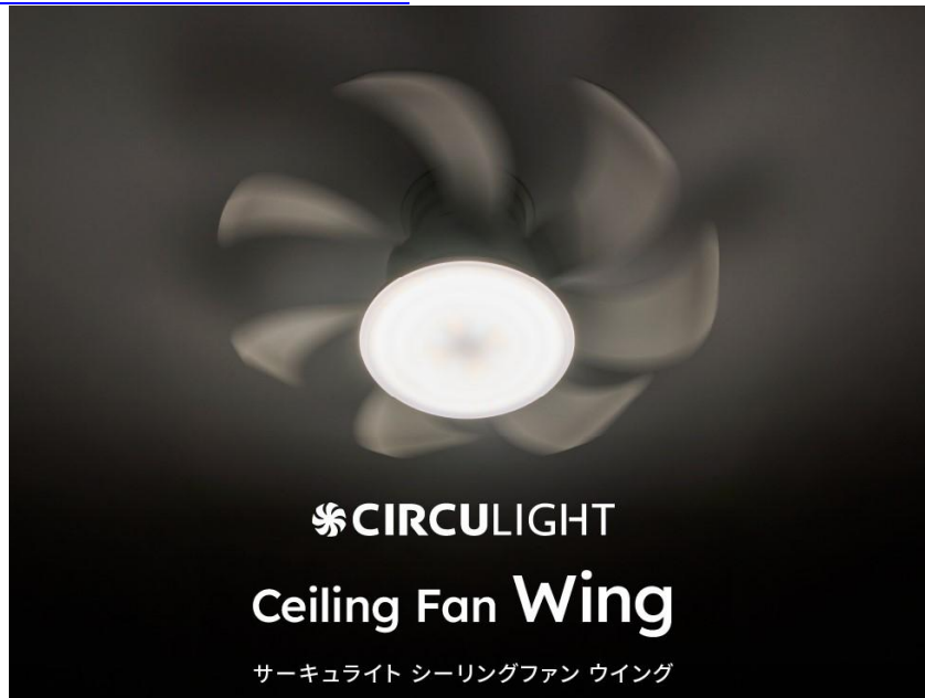
「サーキュライト ウイング」

URL： https://circulight.com/wing-standard/