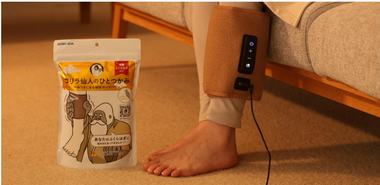
「ゴリラ仙人のひとつかみ」

URL： https://e-doshisha.com/hanako/gorilla_sennin_hitotsukami/