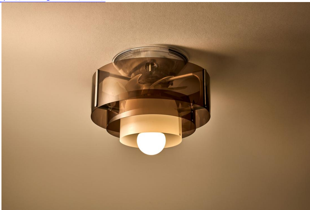
「サーキュライト HELIX (ヘリックス)」