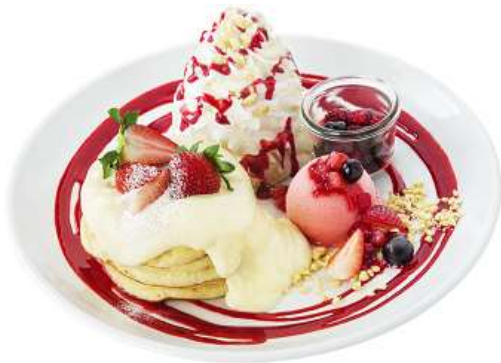
ベリーメリーホワイトパンケーキ 1,580円(税別)