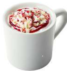
ストロベリーホワイトショコラ 580円(税別)