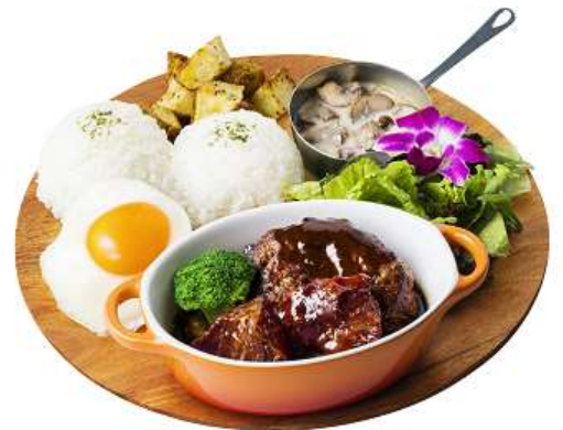
ホリデー ビーフシチュー ロコモコ 1,780円(税別)

フェア期間中に『ベリーメリーホワイトパンケーキ』または『ホリデービーフシチューロコモコ』をご注文いただくと、もれなく『Kona's Coffee ～Mele Kalikimaka～』オリジナルステッカーをプレゼント！