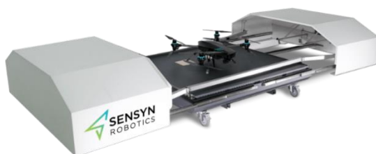
「SENSYN DRONE HUB」