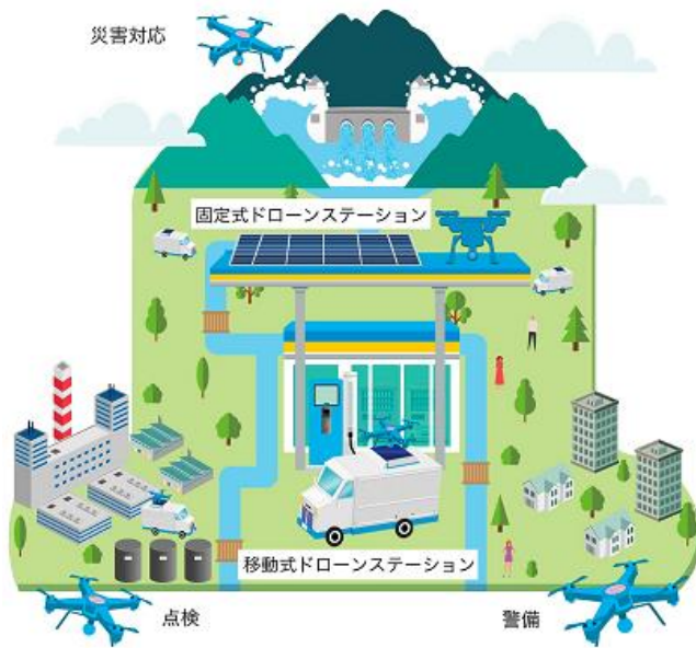
ステーションを起点に各種サービスを提供