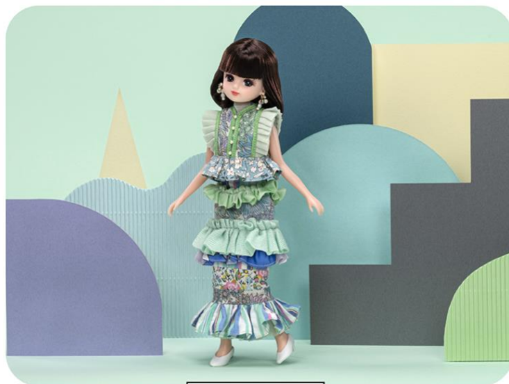
新宿イーストサイド

全国 31 施設での展示は 4 月 1 日（火）より順次開催いたします。展示スケジュールは施設ごとに異なるため、特設 WEB サイトにてご確認ください。