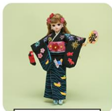
メルキュール 大阪なんば