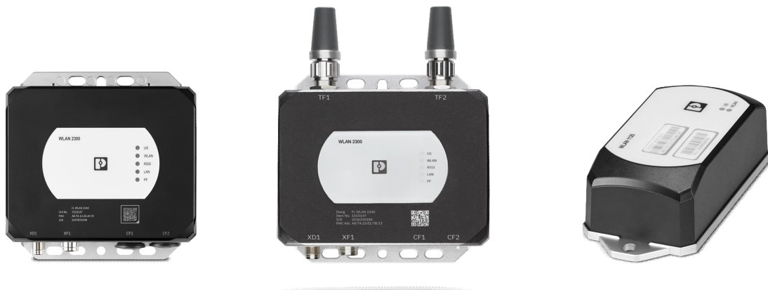
図1：新製品外観（左からFL WLAN 2340, FL WLAN 2330, FL WLAN 1122）

柔軟な生産環境実現等のため AGV/AMR の導入が進んでいますが、それら移動体との無線通信は低遅延性と高信頼性が不可欠です。また、産業用設備のメンテナンスにおいて、配線費用工数の低減、携帯端末の利用、可視化したいデータ量の増加といったニーズがあり、無線による高速通信の需要が増えています。Wi-Fi 6(E)対応の FL WLAN シリーズ製品を使用することで、そのような目的に合致した低遅延でセキュアなシステム構築が多くの国の現場で可能となります。（参照：次項図 2）