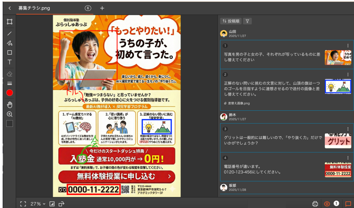
操作画面のイメージ