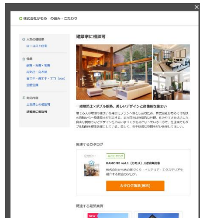
▲会社の強み・こだわり詳細