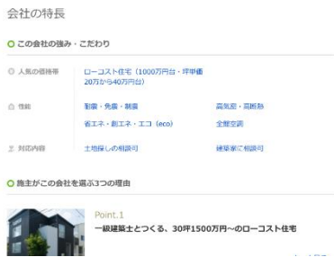
▲会社の強み・こだわり一覧

会社情報に会社の強み・こだわりを一覧表示することで、比較検討がしやすくなり、さらに施主がその会社を選ぶ理由といった、注文住宅検討者の目線で強みがわかるコンテンツを新たに追加しました。また建築事例も、実例写真、施主・担当者のコメントを通して、魅力がより深く伝わるコンテンツに進化させました。このようにコンテンツが充実することで、検討者のより深い検討を可能にします。