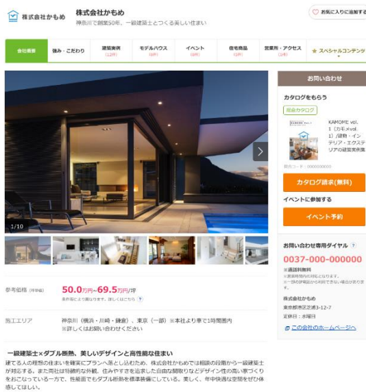
▲施工価格帯表示イメージ