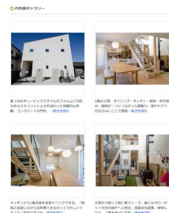
▲実例写真のイメージ

これからも、注文住宅検討者が希望通りの建築会社に出会えるように、より良いサービスを提供してまいります。