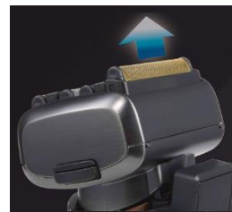
ナローシェーブモード