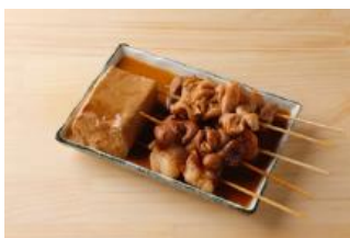
名物 白煮込み ¥950

グラスに浮いたショットグラスヘチャミスルを落とす「千酉足」独自のスタイル 名物ドリンク『チャミスル』(商標出願中)