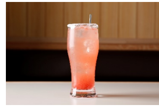
旨塩トマトソース ¥590