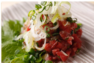
イチボのなめろう ¥500