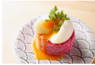
名物 ポテトサラダ ¥500