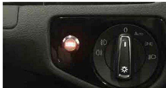
装着・点灯イメージ：BREX ORIGINAL (フォルクスワーゲン Golf7)