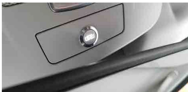
装着・点灯イメージ：BREX WHITE (メルセデス・ベンツ G-Class)