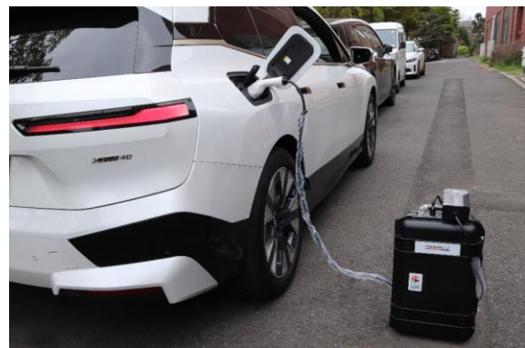
▲充電機能を備えたレッカー車（左）とポータブル充電器（右）