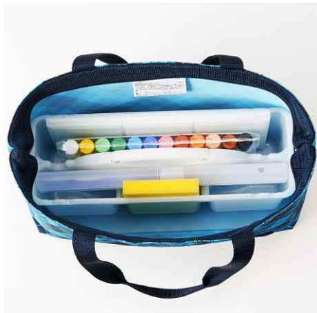
ワイドオープンだから、出し入れ楽々。