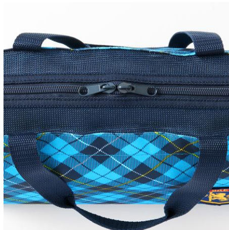
双方向に開閉できるダブルファスナー。