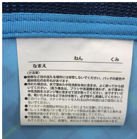
プライバシーに配慮し、お名前ラベルはバッグ内側に縫製。